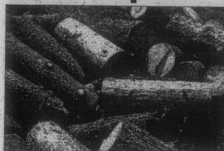
Koje sve rasprodavao šuma

Sve do prije nedavno mnogi drvopre- vači bili su skeptični i če izvoz trupaca ikada bilo zaustavljen, s ob-