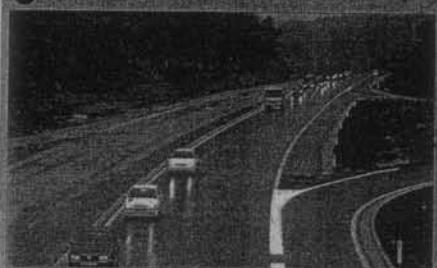
U Srbiji, gdje je struja jeftinija nego u BiH, izvoznici struje mogu biti u prednosti.

U Srbiji, gdje je struja jeftinija nego u BiH, izvoznici struje mogu biti u prednosti. Ovo je znak da je Drvo BiH institucija koja može uložiti na vlasti kako ti ona sproveda u djelo i neke druge inicijative poduzetnika. Zbog toga i nije čudo da je Udruženje u posljednjih nekoliko dana dobilo podršku brojnih poslodavaca i nove pristupnice o učlanjenju. Oni su se tak sada uvjerali da je Udruženje, za razliku od nekih drugih privrednih asocijacija, u stanju izboriti se za njihove zahtjeve.