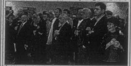
Citacat „Dana“ na promociji