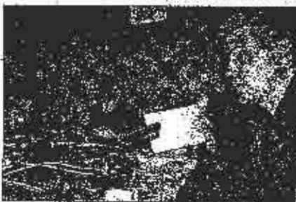
SDP: vlasti žute nakon objave listovnog spiska

Nakon sjednice Zastupničkog doma Parlamenta Federacije BiH, održane u utorak, postalo je poznato da ova vlast nema namjeru ući u odlučan obračun sa idokornim organizacijama i okupirane bh. relne teritorije, nego se sa neistovrsnim organiziranim kriminalom u BiH, nastavlja se u saradnji SDP BiH.