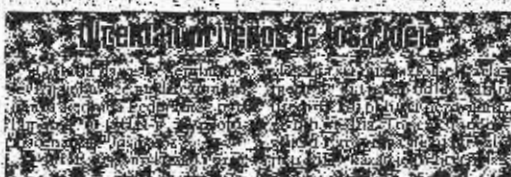
Društvo pisaca BiH