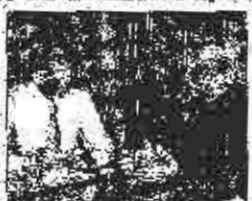
S razgovorom: Pava II dolazi u dobru volji

U tom kontekstu zajednički je upućen poziv svim ljudima do- bre volje da svojom prisustvom čestitaju ovaj veliki događaj.