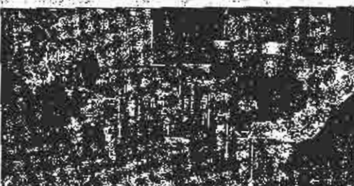
Sa sastanka u Banjoj Luci