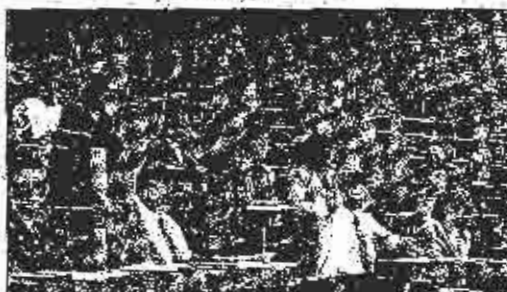
Sa jučerašnje sjednice: Rasprava o prijedlogu zakona

- Mi smo tražili da se uba- vimo raspisati konkursi za rukovo- deće državne službenike. Me-