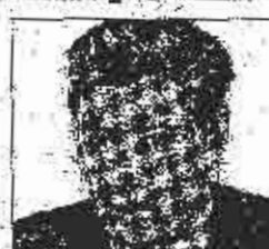
Braćević: Evropski standardi

On dodaje da je obavio Fed- eralne vlade da osigura oslove da se zakon provede. Poželjno je da je potrebno formirati agenciju koja će to uraditi, a službenici će reati na svojim radnim mjestima dok