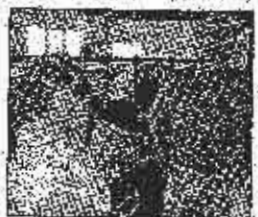
Ešdaun je sa suprugom Džejn obišao i farmu krmu

Nas poljoprivrednici i pita za početak naših proizvoda, a mi se možemo otići dokazati jer naš status nije riješen - rekao je Zivanić.