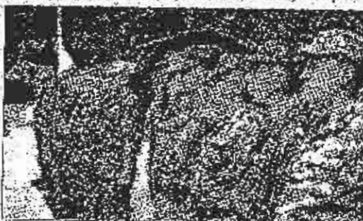
Svečane svedbe jedinice "Sjever", Vojske Republike Srpske, ambasador Ruske Federacije u BiH Aleksandar Sergejev

Svečanosti u Ugljeviku prisustvovali su i komandant SFOR-a Vilijam Ward, predstavnici Međunarodne divizije