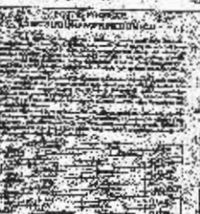
Faktni dio potpisa koji građani Tešnja stavljaju na peticiju

da su mogli već odavno trebali plaćati nagradu na sve što se u posljednje vrijeme pojavljuje u raznim izdanjima o Mehmedoviću, ali nisu.