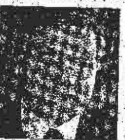
Kozarac: Skupina izvodi političke

Iako pozivajući na brzo rješenje, predstavnici zemalja nasljednica bivše SFRJ usaglasili su i o koordiniranom nastupu u ugovaranju poslova u poslijeratnoj obnovi Iraka.