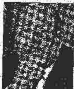
Hejz: Ustavni Buldožer 2 su vrlo intenzivno u istraživanju zemljana

On je obavio i skopu pokretanje rada "Buldožer komisije 2". Prema njegovim riječima, rezultati prvog dijela aktivnosti "Buldožer komisije" pobuđili