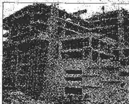
Vrijednost cjelokupne investicije u ovaj projekt je 50 miliona USD