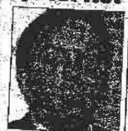
Teizle: Znach zukopun

Sagovornici su ao saglasili da prioriteti investitunja EERD-a-trebrja biri usmjercal g iri sektora infristrukture: ce-