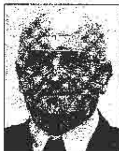
Paravac: Prijedlog SDS-a