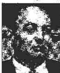
Bičakčić: Sadem krivični prijava

SDA i SRH bi sve novine transakcije i jedini nadzor njihove zakonitosti potpuno prepustili HDZ-u, koji već kontroliše ministarstva, Finansijska na državnom i federalnom nivou.