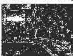
Vlada FBiH: Prijedlozi opasani u Parlamentu

Jučer utvrđenim prijedlozima zakona koje će uputiti u Parlament FBiH na osvajanje po hitnom postupku i donošenju podzakonskih akata, Federalna vlada ispunila je obaveze koje se, prema "Buldožer komisiji", odnose na FBiH, saopćeno je iz Ureda za informiranje Vlade FBiH, a prenijela je Fena.