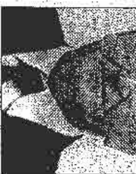
Paravac: Bez komentara

Prema našim saznanjima, ima visok rejting u SDS-u, jer njegovom zaslugom i angažovanjem ta stranka nikada nije izgubila veliki utjecaj koji ima u dobroćudnoj regiji, pa ni 1997. godine kada je bivši predsjednik RS Biljana Plavšić napustila SDS i za sobom povukla brojno članstvo.