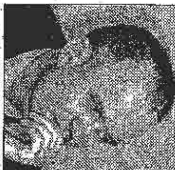
Čavić: Neadekvatan status oficira

Prema njegovim riječima, situacija mnogih oficira u RS od rata bio je neadekvatna i dvojni, ispitivali su se njihova prava i služba u JNA i Vojski SRJ i Vojski RS, a mnogi, oficiri do februara 2002.