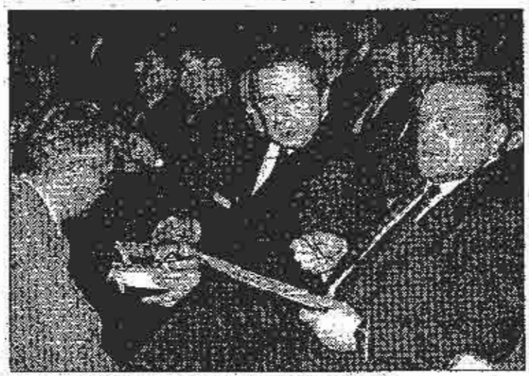
Sa skupa u Sarajevu: Sve je manje vremena za reforme

Povi zamienik Pedija E80aина паропениоте да ѕи бізгі: smenima notrebni jedinstven ekonojnski proster, hiberaliza: ona, pragmaticna i biza privui:žučija, (mansparentna i biza odluka u slučaju bilo kakvog komercijalnog spora, vlasti ko-je su brze i nakloujena izvo-zmekowijenorznoj powedl te da stvaranje lik pretpostavki nije ni nemogać na tezak pread Od njegovog uspjeha korist će nastosva, navedio je beja.