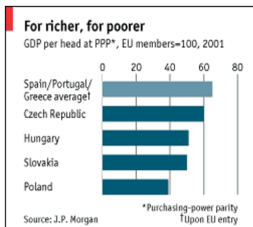
Слика 1 3

без посла. И како државна влада поново успоставља службе (ветеринарска инспекција представља само један примјер) којих од