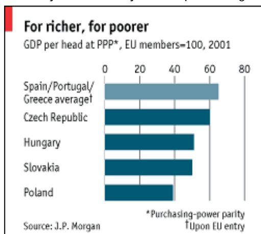
Slika 1 3

Jasna je činjenica da pridruživanje EU zahtijeva efikasne javne institucije a Evropske integracije