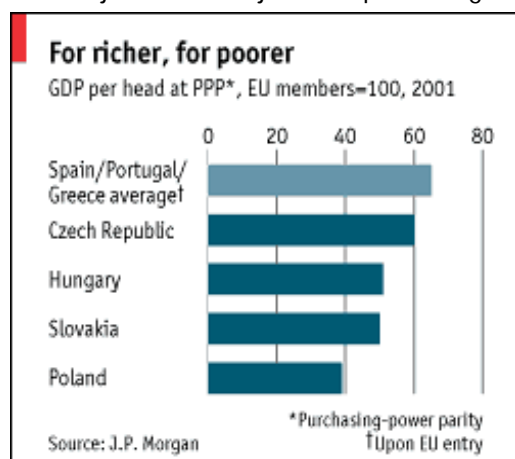
Slika 1 3

Jasna je činjenica da pridruživanje EU zahtijeva efikasne javne institucije a Evropske integracije