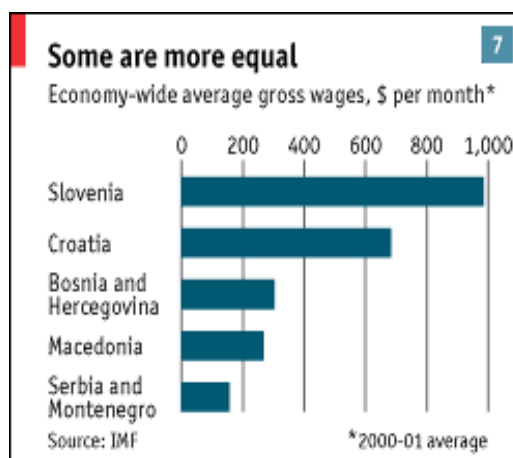
Slika 2 4

administrativnog tipa i posvete dosta energije i prihoda u svom radu u pravcu usvajanja i asimilacije acquis communitaire . Ni jedna od njih nije morala istovremeno da izgrađuje državu istovremeno sa ovim procesom.