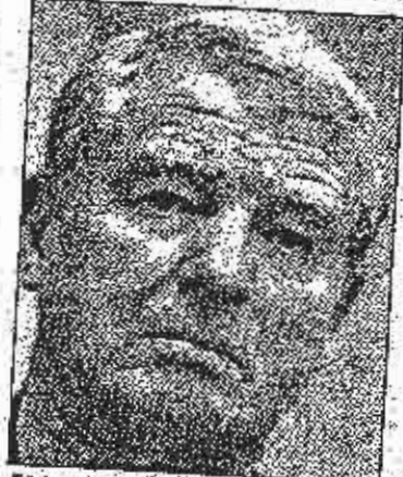
Esdaun: Ukloniti zapreke investitorima.

«Već su nam počeli pristizati njihovi odgovori, a oni su iskazali svoj interes da učestynju u ovom procesu. Ešdaunov je stav da reforma ovog segmenta bh, društva može biti uspješna samo ako se u nju ukljuće i sa-